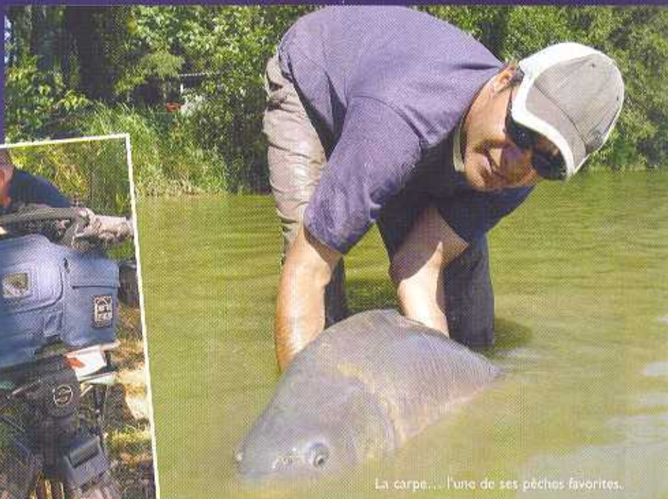
La carpe... l'une de ses pêches favorites.

D'une certaine manière, il tue l'esprit de la pêche... En Grande-Bretagne, les pêcheurs sont entrés dans une espèce de compétition. Leur objectif principal est de capturer un maximum de poissons spécimens. La notion de prendre plaisir à une aventure où de partager des moments magiques est passée au second plan. Beaucoup ont tendance à oublier que le bonheur devrait débiter à la minute où l'on arrive au bord de l'eau et ne devrait pas s'arrêter jusqu'à celle du départ !