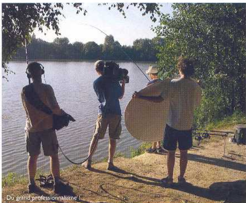
Du grand professionnalisme !

C'est un projet très excitant, le premier de ce genre à être réalisé à l'échelon européen.